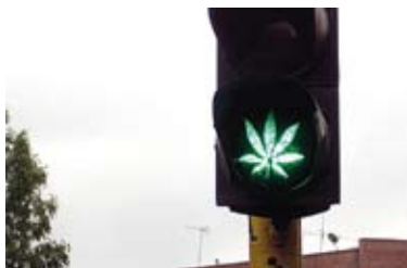
Hasch blir tillåtet i affärer i Köpenhamn om vissa politiker får som de vill.

■ Trots att vi klagat över att det finns alltför mycket alkohol och andra droger i Stockholm så kan vi konstatera att det är i alla fall bättre än i Köpenhamn.