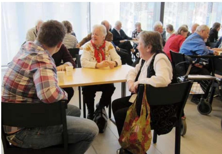
Goda samtal och beslut om framtiden fanns det gott om på IOGT-NTOs distriktsårsmöte i Upplands Väsby.